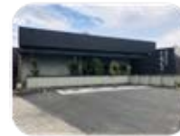
ホルモンしらいし